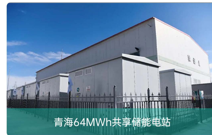
青海64MWh共享储能电站