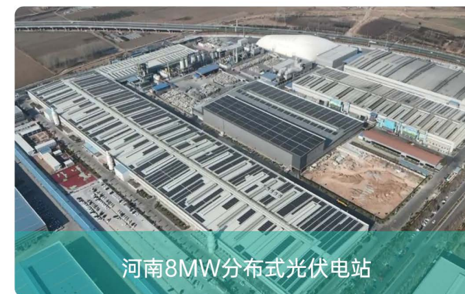
河南8MW分布式光伏电站