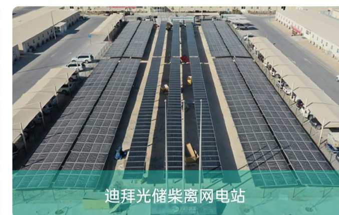
迪拜光储柴离网电站