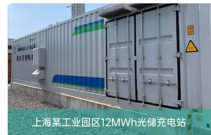
上海某工业园区12MWh光储充电站